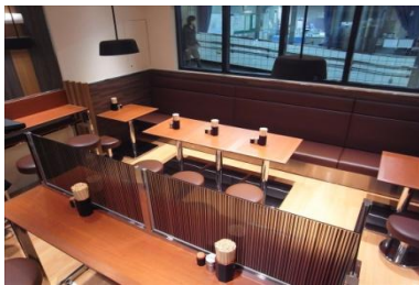
着席数が増えた店内