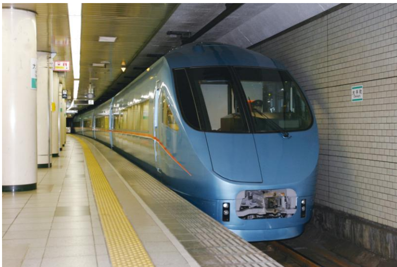
「メトロおさんぽ号」に使用するロマンスカー・MSE（60000形）