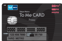
To Me CARD Prime