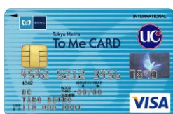
To Me CARD UC 一般カード