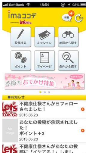
「ima ココデ」アプリイメージ