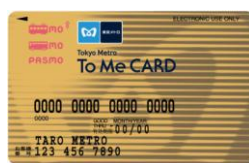
To Me CARD PASMO ゴールドカード