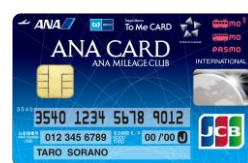
ANA To Me CARD PASMO JCB （愛称：ソラチカカード）

※券面画像はイメージです。※To Me CARD Prime は、JCB・ニコスからご選択いただけます。