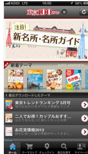
「東京 100 ガイド」アプリイメージ

■アプリは Google play、App Store にてダウンロード可能です。