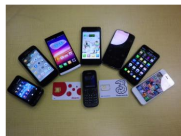
（SIM フリー携帯電話と SIM カード）

SIM フリー携帯電話では SIM カードを自由に替えることができることから、例えば日本国内のお客様が海外に行った際、訪問先の国の携帯電話キャリアの SIM カードを購入することで、訪問先国内の電話料金で携帯電話を利用することが可能となる。