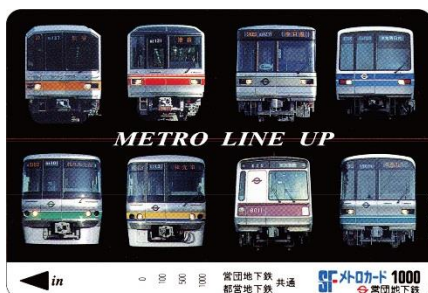
SFメトロカード（パスネットロゴなし。）