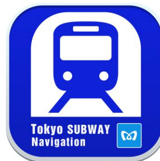
アプリケーションアイコン