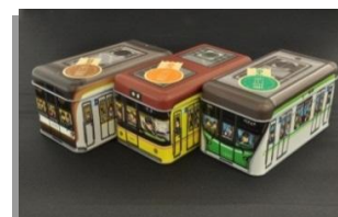
東京三步 各 650 円(税込)

大人気で完売した半蔵門線ミニタオルを「メトロの缶詰 in 押上」限定で再販売！！