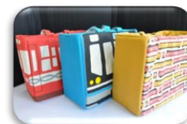
でかバッグ 各 3,900 円(税込)