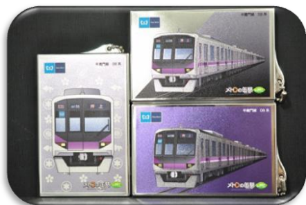
「メトロの缶詰 in 押上」限定 タッチ&ゴー 各 700 円(税込)

半蔵門線 08 系をモチーフにした「メトロの缶詰 in 押上」のかわいいロゴ入りタッチ&ゴーです。