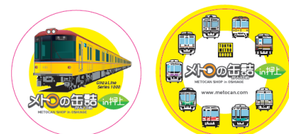
【オープン記念シール】直径約 9 cm