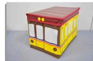
新商品 おもちゃ BOX(銀座線) 2,000 円(税込)