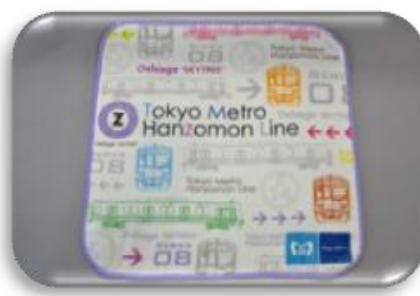
「メトロの缶詰 in 押上」限定 半蔵門線ミニタオル 500 円(税込)

半蔵門線 08 系をモチーフにした「メトロの缶詰 in 押上」のかわいいロゴ入りタッチ&ゴーです。