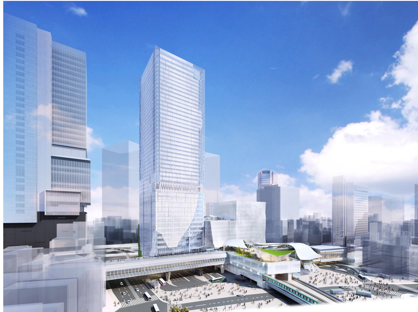
宮益坂交差点方面より望む