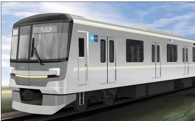
東京メトロ 13000 系