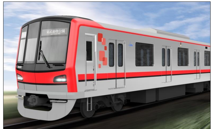
東武鉄道 70000 系