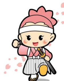
新島八重マスコットキャラクター「八重たん」