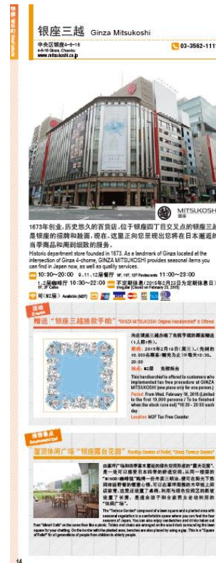
▲リーフレットイメージ