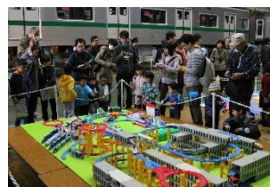
プラレール 「メトロ・プラレール展示」

© TOMY 「プラレール」は株式会社タカラトミーの登録商標です。 ※画像は2014年の様子です。