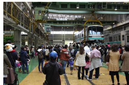
大きな車体が吊り上げられる迫力を体感できる「車体吊上げ実演」