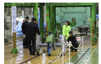
「ぐるっと車輪くん」

© TOMY 「プラレール」は株式会社タカラトミーの登録商標です。 ※画像は2014年の様子です。