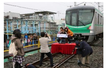
「子ども制服撮影会」