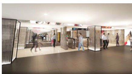
【第2弾】商業エリア最優秀作品