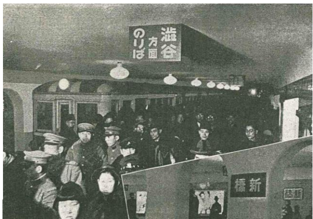
1939年(昭和14年)当時の幻のホーム