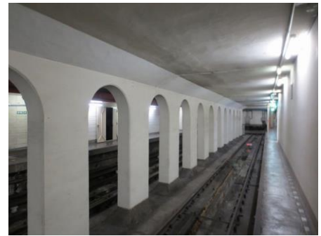
新橋駅「幻のホーム」

【 駅デザイン部門 】では、新橋、溜池山王、赤坂見附の3駅の駅デザイン、望ましいユーザー経験を、【 幻のホーム活用アイデア部門 】では、新橋駅に存在する「幻のホーム」の空間活用方法について、皆様から斬新でユニークなアイデアの募集を行います。