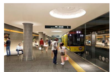
【第1弾】下町エリア最優秀作品