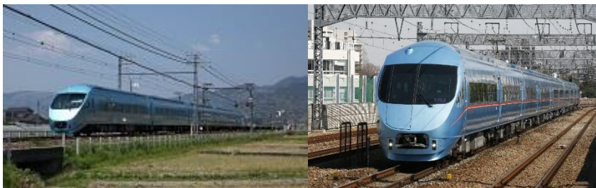
「メトロおさんぽ号」に使用するロマンスカー・MSE（60000形）