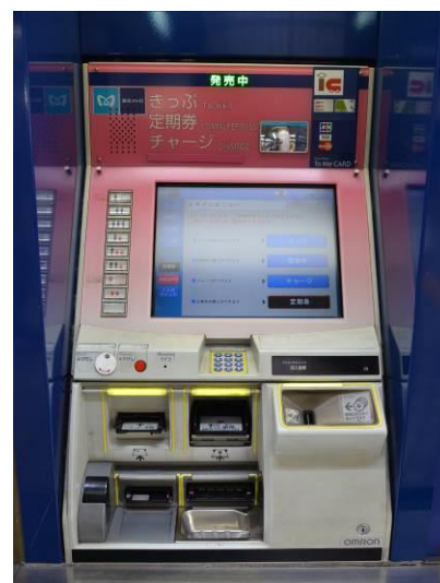
多機能券売機（ピンク色の券売機）