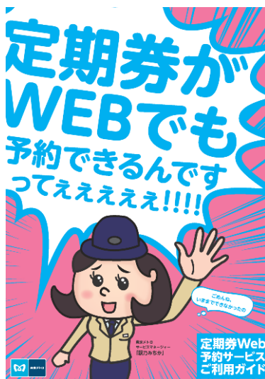
お客様向けご案内冊子イメージ