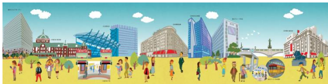
オリジナルきっぷ台紙・外面(イメージ)