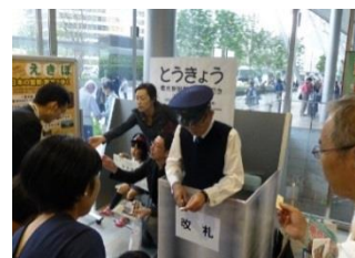
入鉄実演イベント(イメージ)

※入鉄を入れることができるのは、各拠点で配布される「記念レプリカきっぷ(硬券)」のみとなり、鉄道会社で発売のきっぷ(普通乗車券、回数券等)への入鉄は行いません。