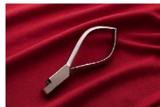
B賞:東京名産セレクション