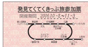
「てんでん祭」配布用