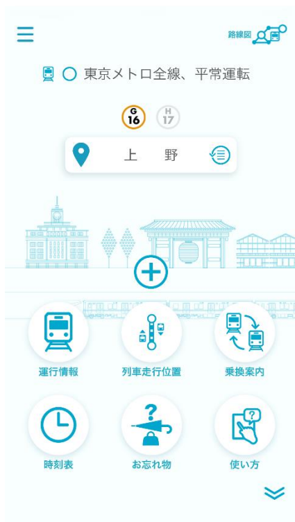
「アプリ TOP」画面イメージ