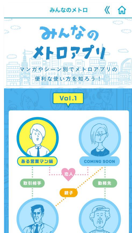
「みんなのメトロアプリ」画面イメージ