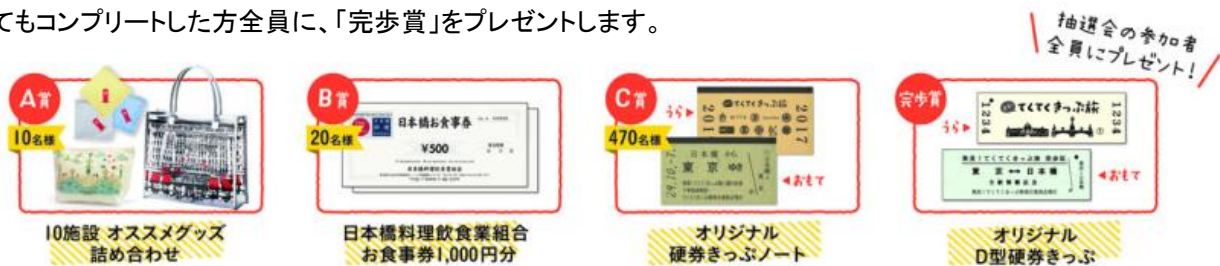
《抽選会賞品 イメージ》

散策対象エリア内の 10 スポット全ての記念レプリカきっぷを集めると、土・日・祝日に「日本橋案内所(COREDO 室町 地下 1 階)」で開催する『抽選会』にご参加いただけます。合計 500 名様に豪華賞品が当たるほか、抽選にはずれてもコンプリートした方全員に、「完歩賞」をプレゼントします。