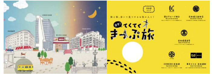
《日本橋エリア散策用 イメージ》