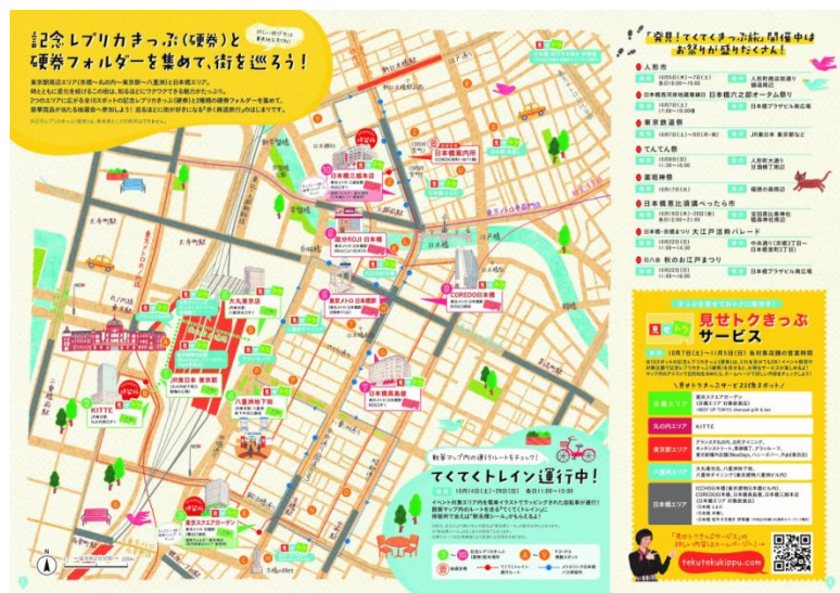
《散策対象エリア イメージ》

【STEP 2】散策対象エリア内の10スポットで「記念レプリカきっぷ(硬券)」を手に入れる。