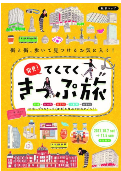
《散策マップ 表紙イメージ》

散策対象エリア内の10スポットでは、「発見！てくてくきっぷ旅」の遊び方やエリアの見どころ、グルメなどを紹介した『散策マップ』を配布します。