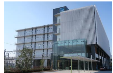
総合研修訓練センター

実施内容：新木場車両基地に隣接する 2016 年 4 月開設の総合研修訓練センターにお客様をご招待し、社員育成の最前線をご紹介します。