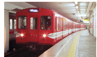
丸ノ内線旧 500 形車両

実施内容：中野車両基地にお客様をご招待し、現在、銀座線と丸ノ内線で活躍する 1000 系特別仕様車両、02 系車両、銀座線で活躍していた 01 系、そして昨年アルゼンチンから里帰りして補修工事を行っていた丸ノ内線旧 500 形車両を一堂に公開いたします。