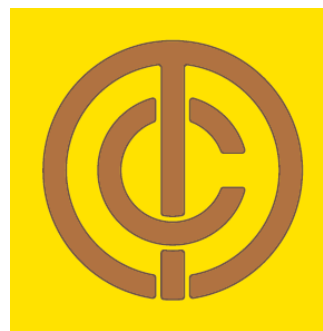
東京地下鐵道社章