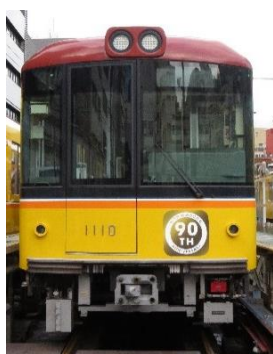
90 周年記念ロゴマーク

「90 年の伝統」と「技術の先端」が融合した銀座線 1000 系をお楽しみください。