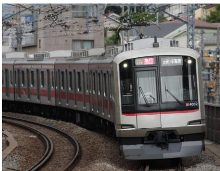
△使用車両（東急電鉄 5050系 4000番台）