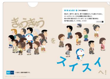
オリジナルクリアファイル（イメージ）