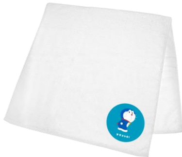
オリジナルバスタオル（イメージ）