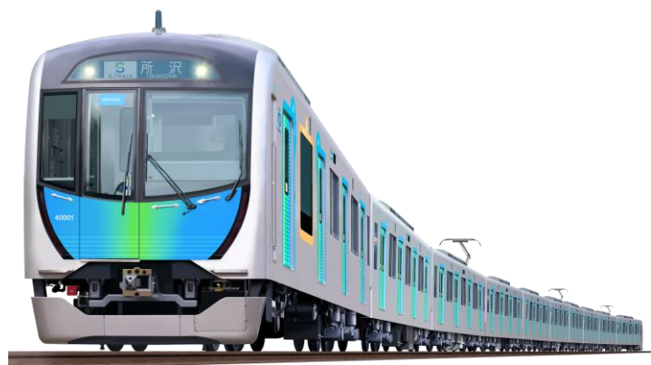
有料座席指定列車「S-TRAIN」