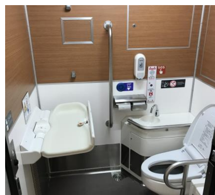
車内トイレ・おむつ交換シート