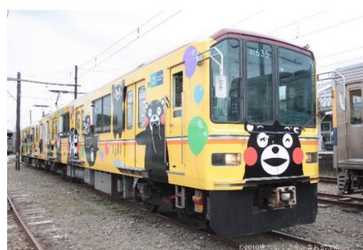
【熊本電鉄 01 形くまモンラッピング電車】