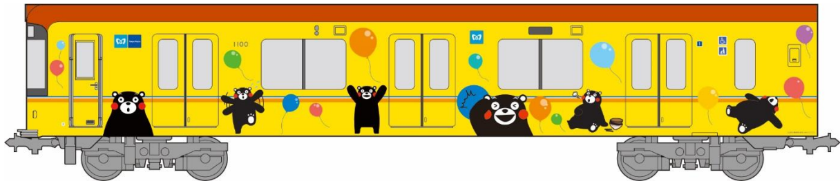
銀座線くまモンラッピング電車イメージ