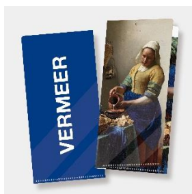
特製チケットファイル