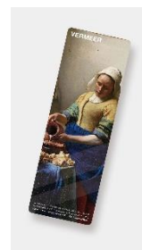
特製プラスチック製しおり