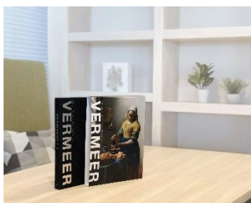
「フェルメール展」公式図録