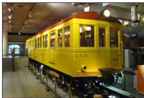
※地下鉄博物館に展示されている 1000 形車両 ※銀座線の名称は 1953 年から使用開始