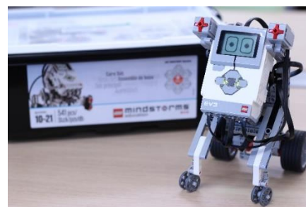
教育版 レゴ(R) マインドストーム(R) EV3

教育版レゴ(R) マインドストーム(R) EV3 を用いて、 モーターや各種センサーを使ったロボット組み立て、 ビジュアルアイコンを使ったソフトウェアでプログラ ミングを行います。