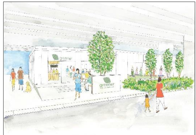
施設イメージ(北側/南側)