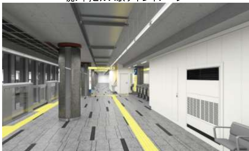
開業時北千住方面行きホームイメージ