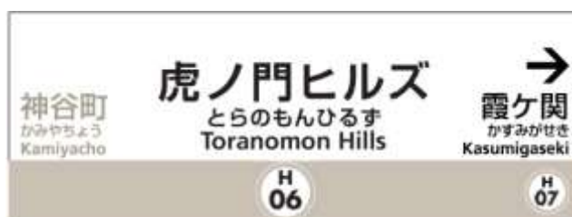
虎ノ門ヒルズ駅サインイメージ