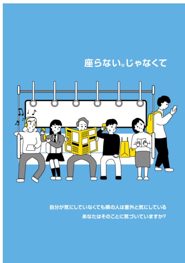
【大賞・特別賞】受賞作品