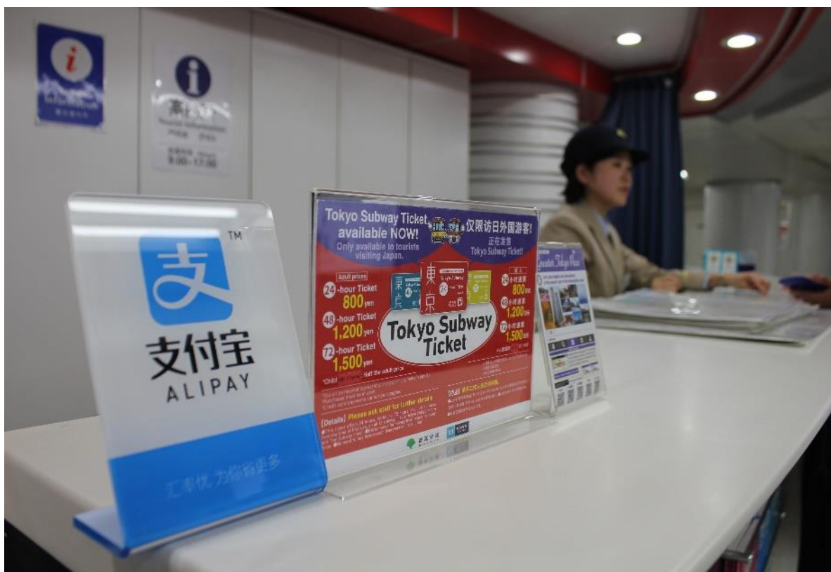
東京駅旅客案内所での Alipay 取扱開始イメージ