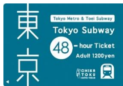
Tokyo Subway 48-hour Ticket