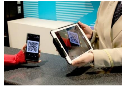
Alipay での発売イメージ