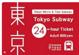
Tokyo Subway 24-hour Ticket

改札通過時から 24、48、72 時間東京メトロ線全 9 路線と都営地下鉄線全 4 路線、合計 13 路線が乗り放題となる旅行者向けの企画乗車券です。「Tokyo Subway Ticket」の詳細は、専用サイト ( https://www.tokyometro.jp/tst/jp ) でご確認ください。