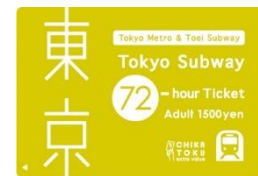
Tokyo Subway 72-hour Ticket