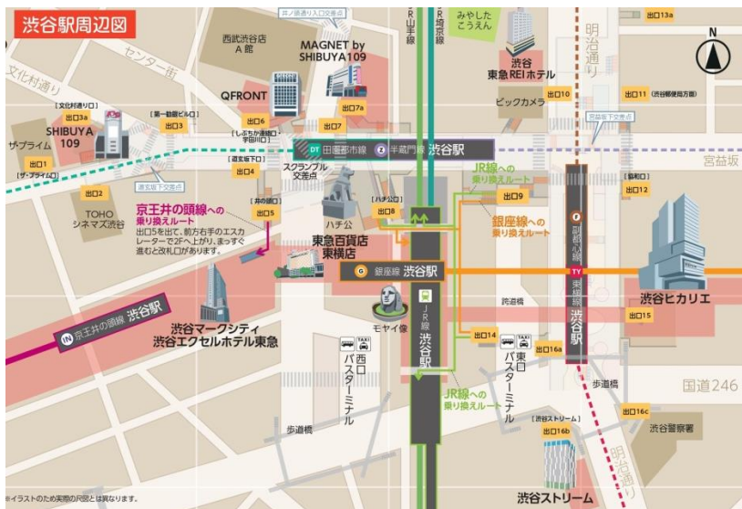
(参考図: 現状の渋谷駅地下出入口番号)