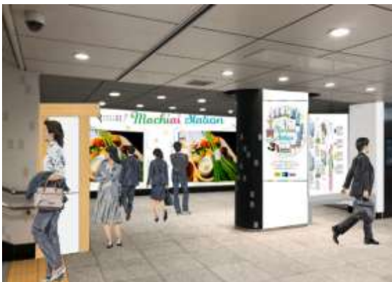
特設スペースイメージ

※お盆（2019年8月15日～17日）とお正月（2020年1月1日～4日）は除く