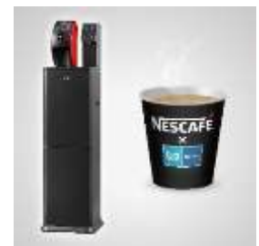
提供コーヒー イメージ