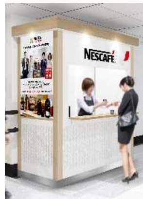
コーヒー提供ブース イメージ