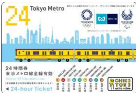
東京 2020 大会エンブレム付き 東京メトロ 24 時間券(前売り券) 大人用 (イメージ)