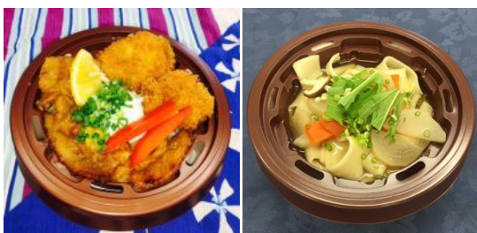
【左】 秩父わらじ豚味噌丼(ミニサイズ)