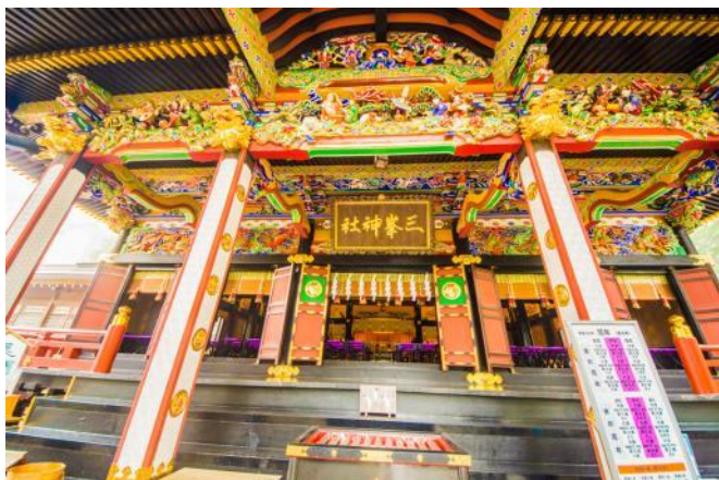
三峯神社 拝殿 豪華絢爛な三峯神社の拝殿。ツアー参加者は拝殿 の中へ入り早朝に特別なご祈祷を受けられます。 以上