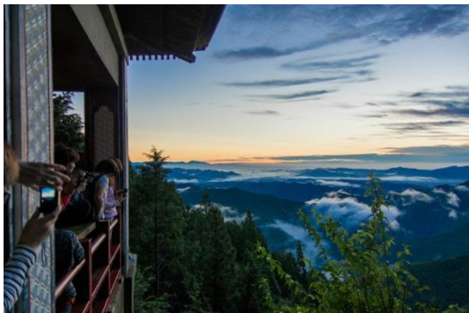
日の出前の空と云海 5時00分頃には朝焼けと云海のコラボレーション を鑑賞することができました。