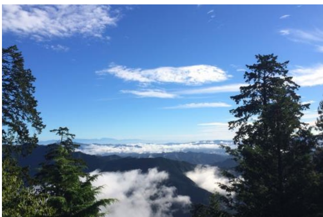
長時間続いた云海 7時00分を過ぎても広大な云海が継続しました。 広大な云海を長時間見られた幸運な日でした。