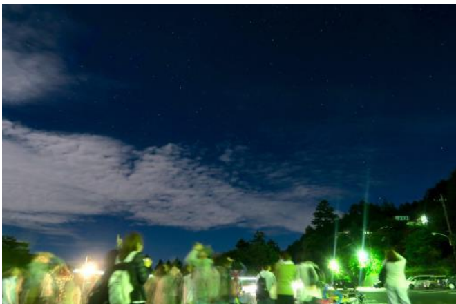
スターパーティ 3時00分頃には満天の星を満喫できました。 ※高感度設定のカメラで撮影しています。