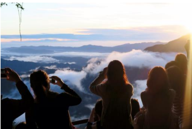
日の出の瞬間 5時00分過ぎには稜線から太陽が昇り、お客さま から思わず感動の声が上がるほどの絶景でした。