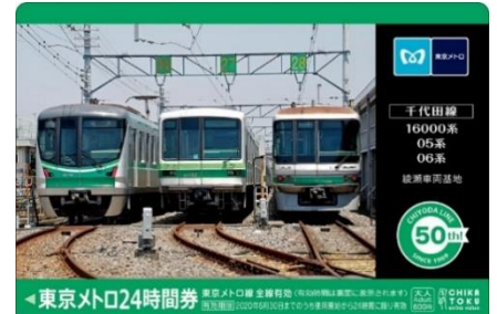
「千代田線オリジナル 24 時間券」（イメージ）