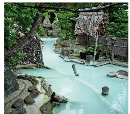
高湯温泉（福島市） 湯船からあふれ出る白濁の硫黄泉は薬効成分が高く、湯治場として利用されている。

また、訪日外国人のお客様向けに多言語版（英語、韓国語、中国語（繁体字・簡体字））の観光案内パンフレットもご用意しています。