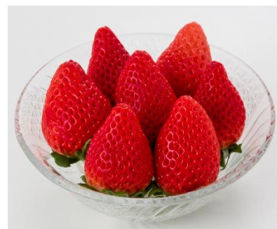
くだもの王国福島県のおいしい「いちご」