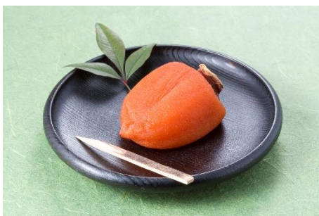
カリウムやビタミンCなどの栄養素を豊富に含む「あんぽ柿」