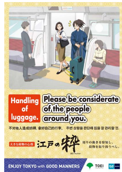
「手荷物」ポスター（イメージ）