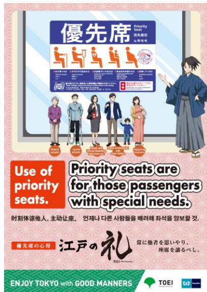
「優先席」ポスター（イメージ）