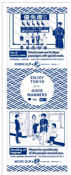
特製手ぬぐい（イメージ）