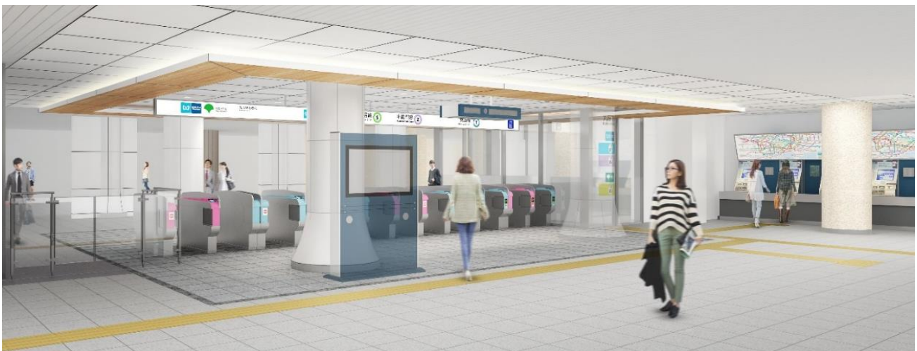
3線共通改札口イメージ（靖国神社・武道館方面改札）