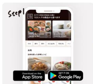
アプリをインストール