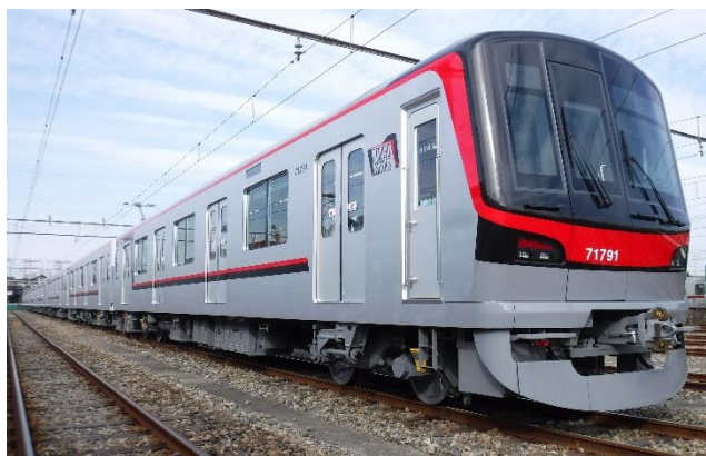
▲東武鉄道 新造車両 70090 型