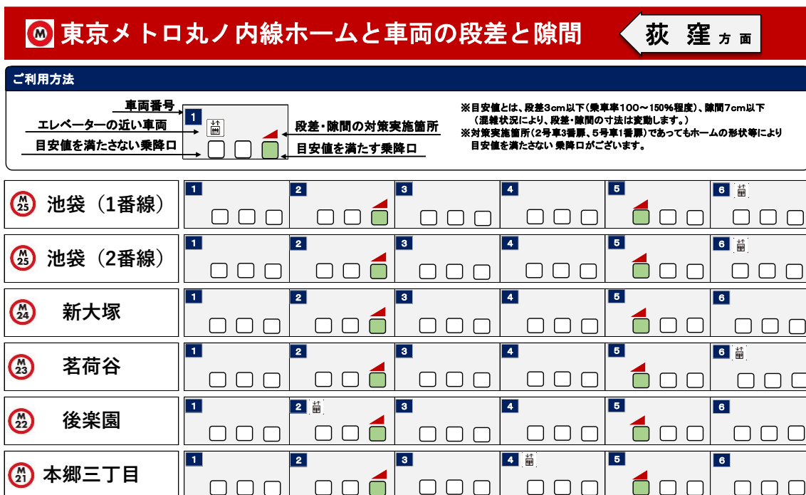
ホームページ公表イメージ（丸ノ内線）

プラットフォームと車両床面の段差・隙間に関する情報の公表概要は、別紙のとおりです。