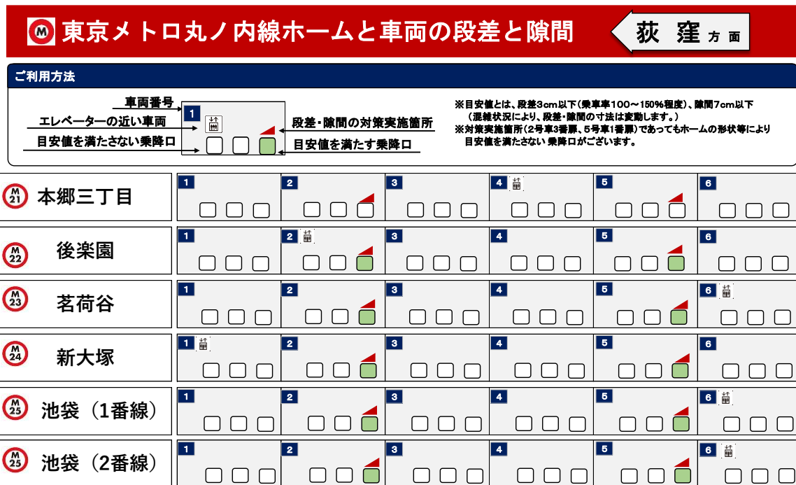
ホームページ公表イメージ（丸ノ内線）

プラットフォームと車両床面の段差・隙間に関する情報の公表概要は、別紙のとおりです。