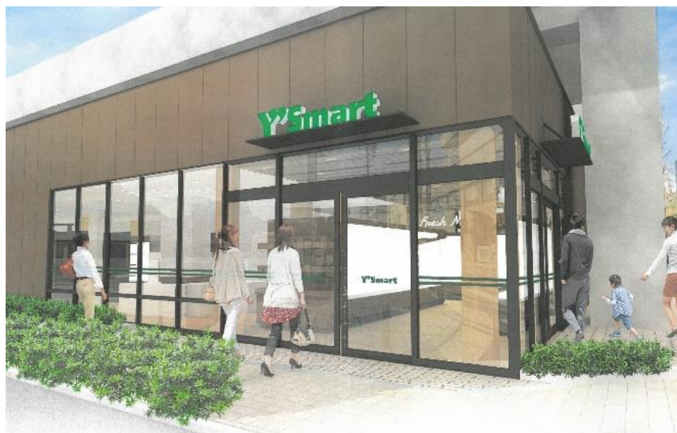
M' av北綾瀬Lieta(第1期)完成イメージ