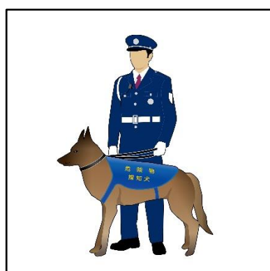
危険物探知犬による 危険物検知（イメージ）