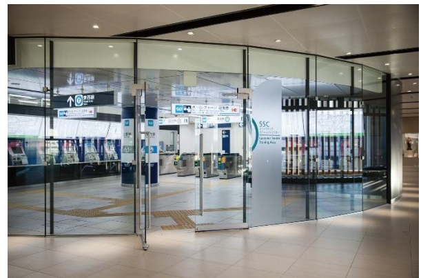
SSC(ステップアップステーションセンター)