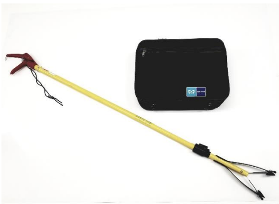
マジックハンド・乗務員カバン