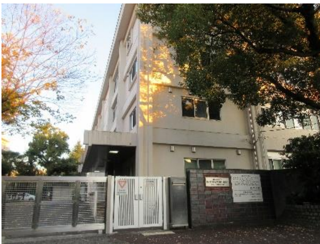
筑波大学付属特別支援学校