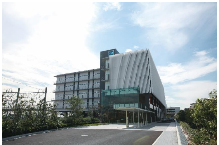
総合研修訓練センター