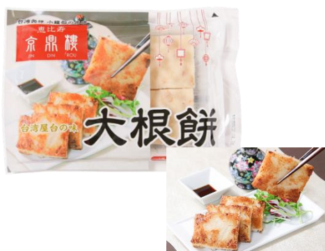
大根餅(4個入) 1,000円(税込)