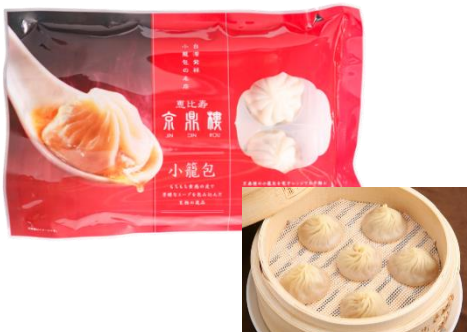
小籠包(6個入) 1,000円(税込)