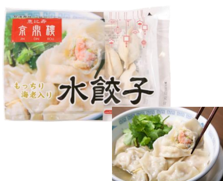
水餃子(6個入) 1,000円(税込)