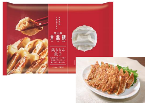
鶏ささみ餃子(15個入) 1,000円(税込)