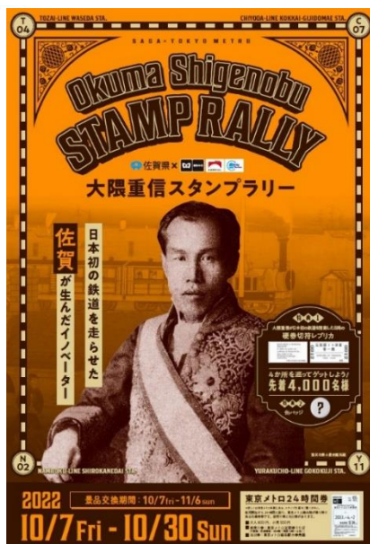
告知ポスターイメージ