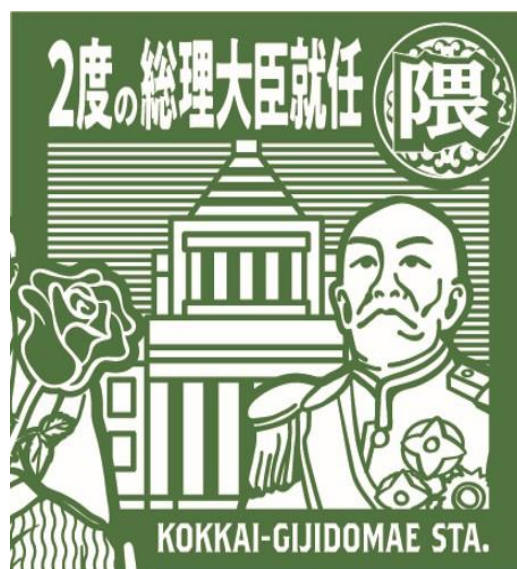
国会議事堂前駅スタンプイメージ