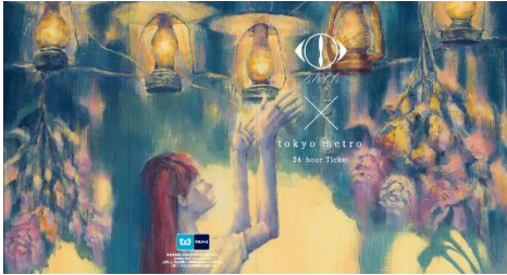
専用台紙ビジュアル (イメージ)