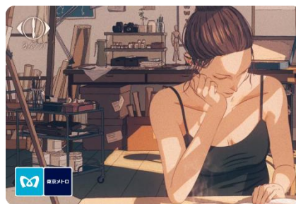
オリジナル 24 時間券（イメージ）