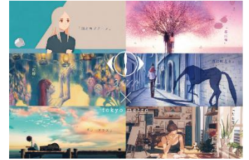
購入特典 (イメージ)