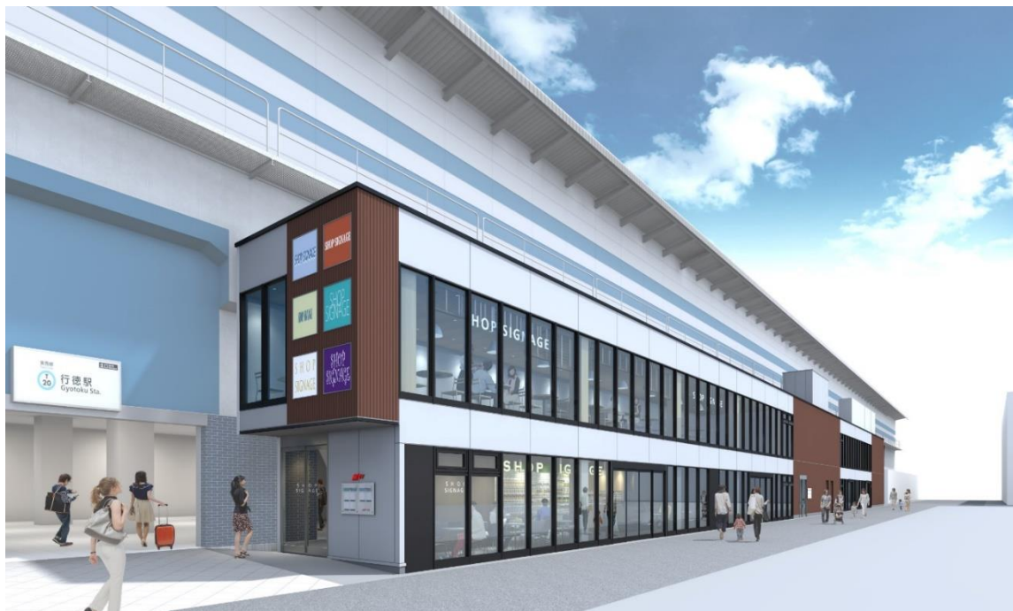
M' av 行徳 駅北口側施設完成イメージ

東京メトログループでは、東西線各駅をはじめ、お客様のニーズや周辺店舗・まちのイメージなどに合わせた高架下商業施設のリニューアルや店舗展開を行い、駅まち一体の賑わいのさらなる創出に取り組んでまいります。詳細は別紙のとおりです。