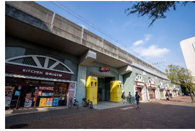
M' av みょうでん

東京メトログループでは、鉄道高架下用地の有効活用を図るため、M' av(マーヴ)みょうでん、メトロセンター等の高架下商業施設を展開しています。